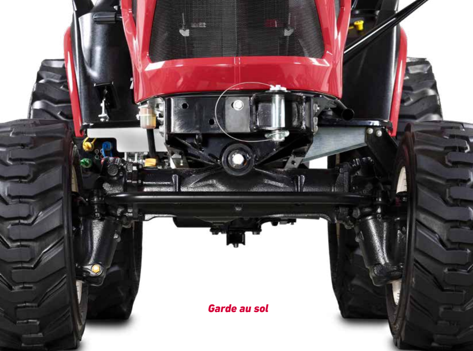
Garde au sol