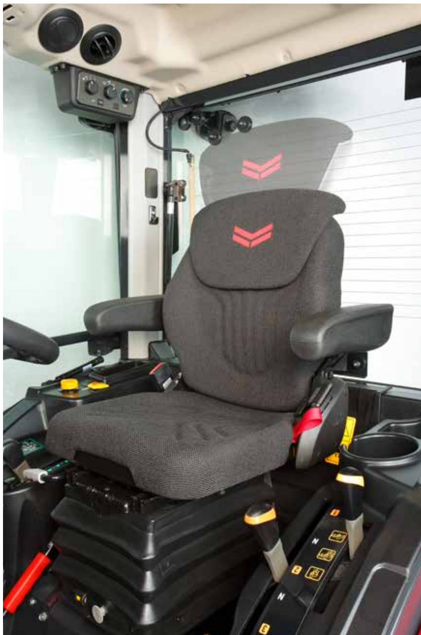
Luxe stoel voor optimaal comfort