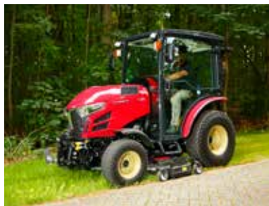
De precisie van de middenmaaier