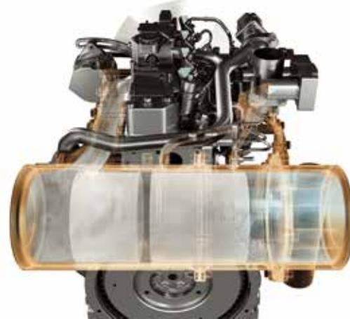
DPF (dieseldeeltjesfilter of roetfilter)