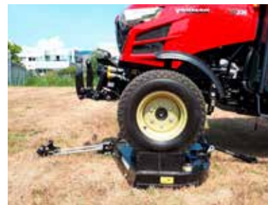
Middenmaaier met drive-over

zijkant is door Yanmar ontworpen om gemakkelijk te worden geïnstalleerd en ontkoppeld dankzij de mogelijkheid voor drive-over.