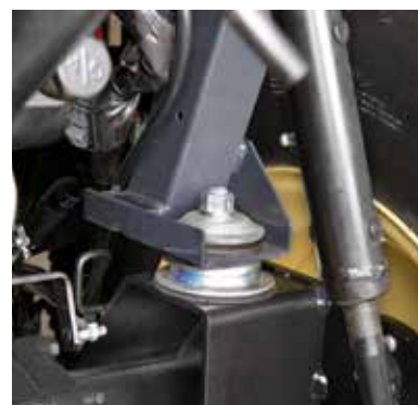
In de fabriek geïnstalleerd voor precisie

Er is een systeem met rubberen antitrillingsbevestigingen ontworpen om zowel trillingen als lawaai tijdens het werk te verminderen. Het rijden is hierdoor comfortabel en het gaat de conventionele slijtage door langdurige werktijden tegen.