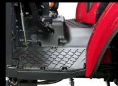
Een vlakke vloer biedt voldoende beenruimte