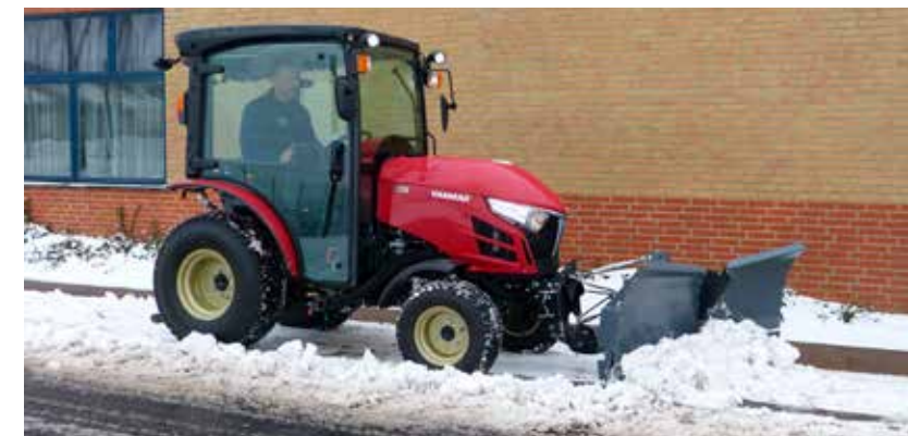
Het uitgebreide werktuigassortiment maakt deze tractoren geschikt voor alle toepassingen

De hendels zijn handig en ergonomisch gesitueerd aan beide zijden van de operator voor intuïtieve bediening.