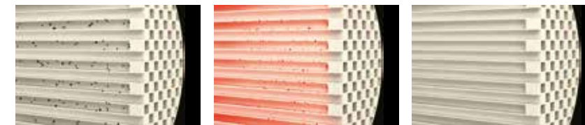
1. Stofdeeltjes gevangen

In de oorspronkelijke DPF-regeneratieregeling van Yanmar worden drie modi gecombineerd