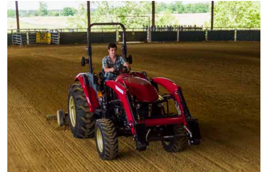
YT2-tractoren combineren een groot aantal verschillende functies en kenmerken waardoor het eigendom en de bediening ervan veel plezier opleveren

Dankzij een topsnelheid van 31 km/h kunt u snel naar andere locaties en