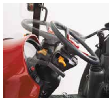
Stuurwiel verstelbaar voor afstemming op de operator

Dankzij de volledige verstelling van het stuurwiel kan de operator de machine perfect op zijn lengte, houding en comfort afstemmen.